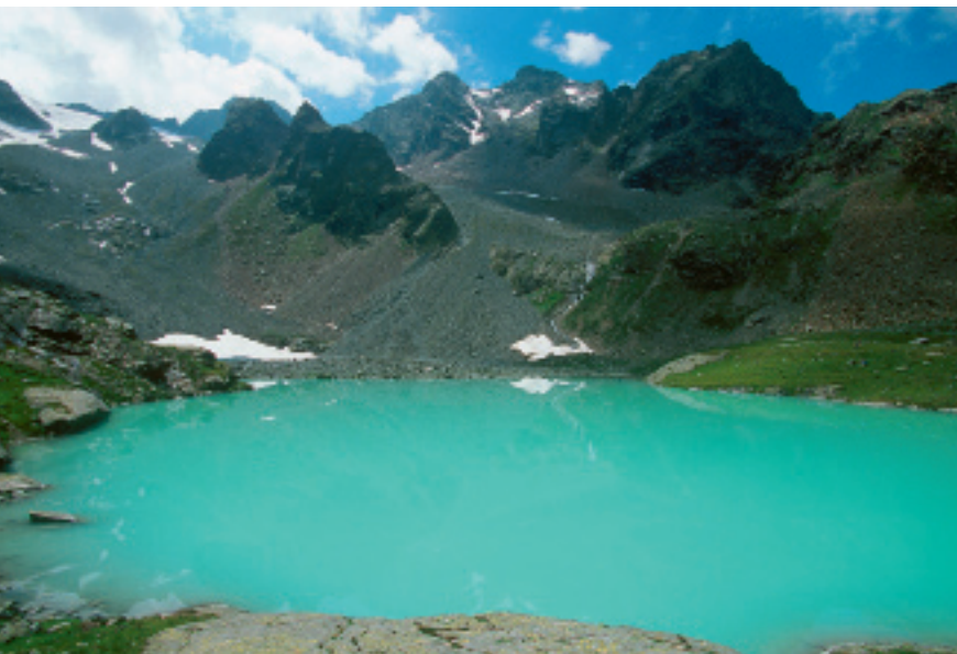
Eingebettet in rauer Gebirgslandschaft: der Hauersee

zieht dann westwärts in das kleine Hauertal. In der Nähe des Baches über Serpentina in freiem Gelände ansteigend zur Selbstversorgerhütte am Hauersee.