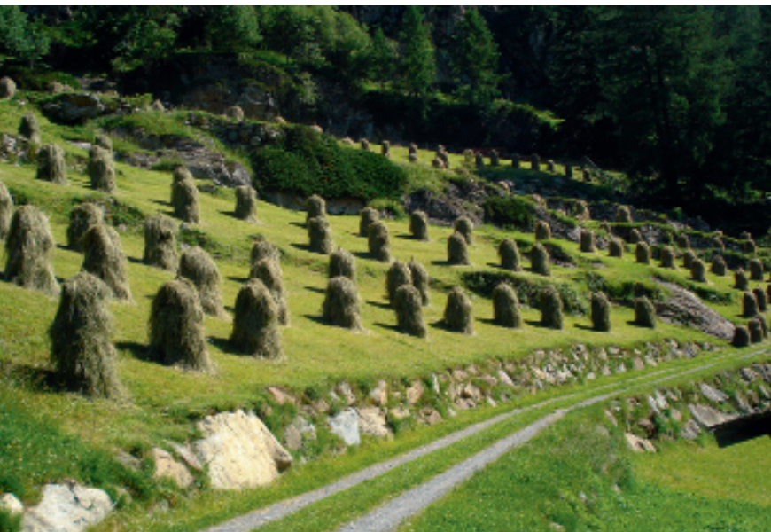
Heuarbeit in Farst

leichtem Auf und Ab dahin. Spechte sind hier häufig zu hören bzw. man findet ihre Spuren: Der Buntspecht (rot-schwarz-weiss) hämmernd runde Löcher in den Baum, auf den Schwarzspecht, den größten heimischen Specht, weisen längliche Schlaglöcher hin, und der Dreizehenspecht hinterlässt Ringe in der Baumrinde, denn er trinkt im Frühjahr den süßen Baumsaft.