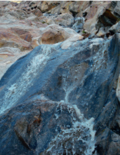
Gletscherschliffe im Gebiet Firmisan

Im Spiegelkar, unterhalb des Vorderen Spiegelkogels und Spiegelferners, hat man eine großartige Sicht auf die gegenüberliegende Wildspitze und den Rofenkarferner. Rechts zieht nun der Weg durch Moränenlandschaft, den Spiegelbach querend, auf eine Graskuppe. Der nächste Bach rieselt glitzernd über Gletscherschliffe herunter.