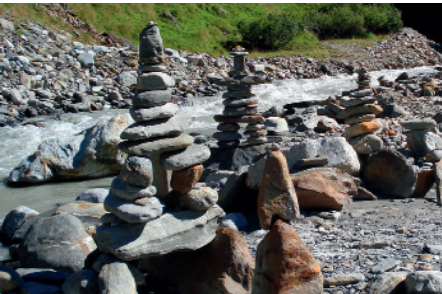
Steinmandln am Niedertalbach

Im Gebiet Firmisan ist es nun eine Schlucht mit dem ungestümen Diembach, die die ganze Aufmerksamkeit auf sich zieht. Eine Versicherung hilft beim kurzen Übergang. Nach diesem nassen Naturschauspiel bietet sich eine Rast an, um die nähere und weitere Gegend zu erkunden: Diemkögel und Diemferner, Schalfkogel, Guslarferner mit Fluchtkogel sind zu sehen. Im weiteren Wegverlauf sieht man das Niedertal ein, mit Martin-Busch-Hütte, Similaunhütte, Marzellkamm und -ferner. Der Abstieg zum Niedertalbach, der anschließende kurze Aufstieg zum Fahrweg und auf diesem hinaus nach Vent verlangen nochmals Ausdauer.