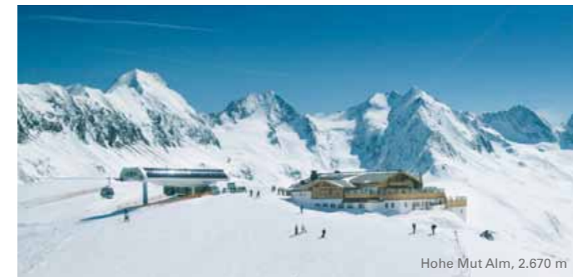
Hohe Mut Alm, 2.670 m

LINIENBUS Met een gastenkaart (verkrijgbaar bij uw gastgever) rijdt u tegen sterk gereduceerde tarieven met alle openbare bussen in het hele Ötztal.