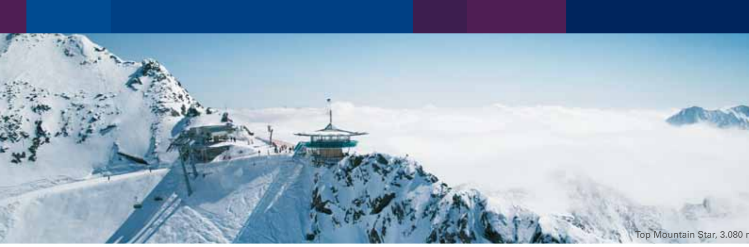
Top Mountain Star, 3.080 m

WELLNESS/ZWEMBAD Saunalandschap, binnenbad & outdoorpool: Art & Relax Hotel Bergwelt