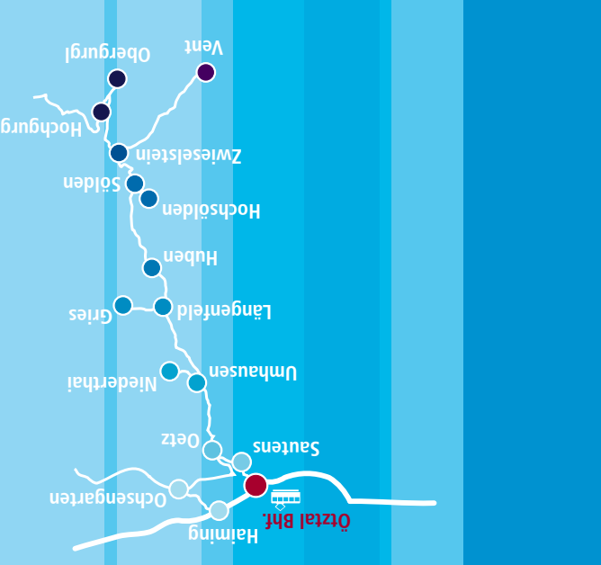
Ötztal, Der Höhepunkt Tirols.